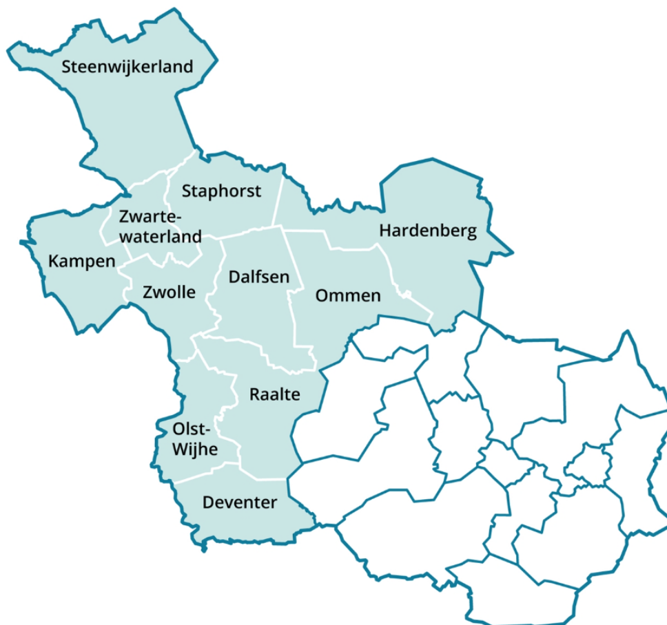
Figuur 2.1 Deelnemende gemeenten in de RES-regio West-Overijssel

Het plangebied betreft het gehele grondgebied van het samenwerkingsverband West-Overijssel. Dit zijn de gemeenten: Dalfsen, Deventer, Hardenberg, Kampen, Olst-Wijhe, Ommen, Raalte, Staphorst, Steenwijkerland, Zwartewaterland en Zwolle.