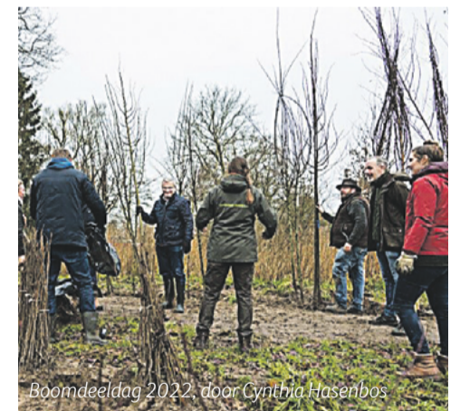
Boomdeeldag 2022, door Cynthia Hasenbos

Woon je in het buitengebied van de gemeente Olst-Wijhe? En heb je plek voor een (fruit)boom/ bosplantsoen op het erf? Doe dan mee met de Boomdeeldagen. Vul op www.iedereeneenboom.nl een aanvraagformulier in en betaal maar 25% van de boom zelf. De rest van het bedrag betalen wij samen met de provincie.